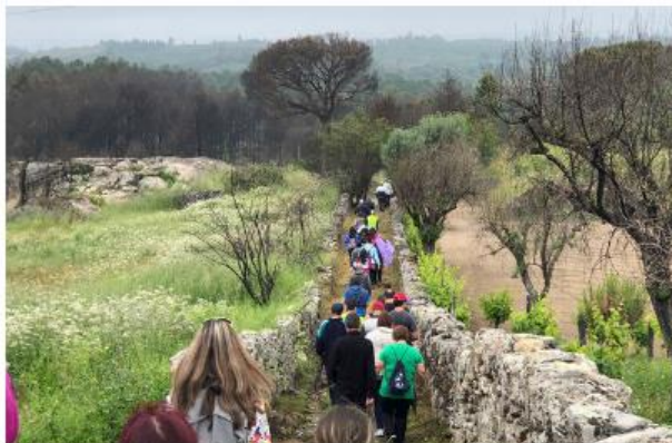
Mangualde, Rota de Santo António dos Cabaços, caminhada

Mais de 60 pessoas conheceram a Rota de Santo António dos Cabaços numa caminhada que teve lugar no passado domingo (3 de junho) em Mangualde. O percurso foi realizado no âmbito da iniciativa “Mangualde em Movimento”, organizada pela Câmara local, e contou com a colaboração da Associação Cultural e Desportiva “Os Ciências”.