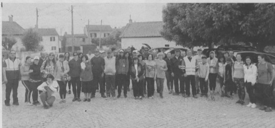
ROTA DE SANTO ANTÓNIO DOS CABAÇOS

A Câmara Municipal de Mangualde convidou a conhecer no passado dia 3 de junho, de forma gratuita, "A Rota de Santo António dos Cabaços", em S. Cosmado.