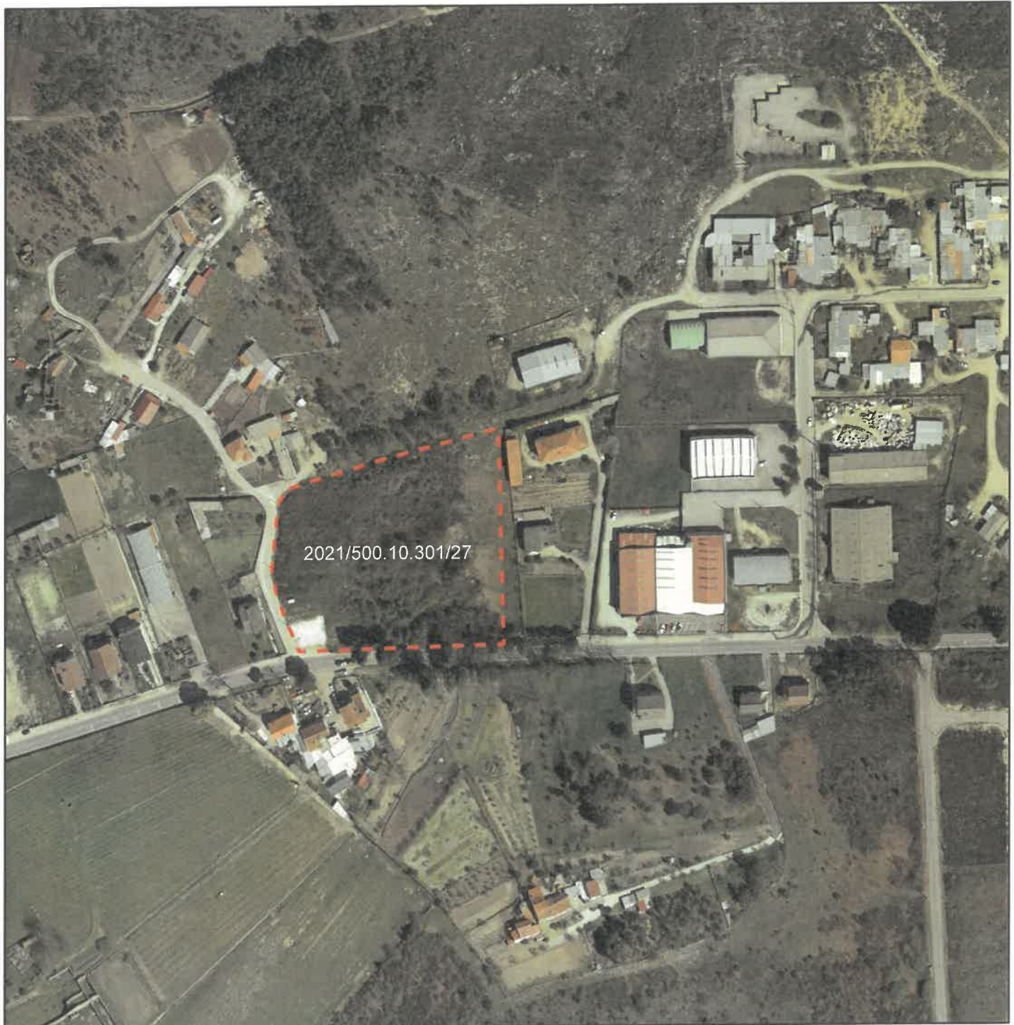
União de Freguesias de Mangualde, Mesquitela e Cunha Alta